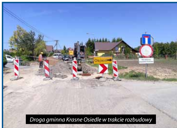
Droga gminna Krasne Osiedle w trakcie rozbudowy

Drugą z inwestycji jest realizowana z Rządowego Programu Polski Ład „Przebudowa drogi wewnętrznej na działkach nr 1180/2, 1181 w Krasnem”, o wartości prac 2 242 889,69 zł, przy 98% dofinansowaniu ze środków zewnętrznych. Roboty realizuje firma MPDiM. Aktualnie realizowane są prace przy przebudowie sieci oraz roboty związane z wykonaniem konstrukcji drogi. Zgodnie z podpisaną umową termin zakończenia inwestycji nastąpi w listopadzie br.