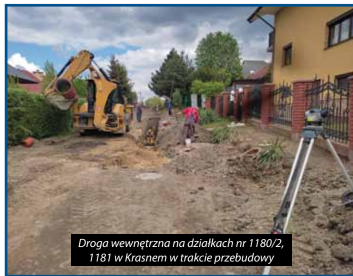
Droga wewnętrzna na działkach nr 1180/2, 1181 w Krasnem w trakcie przebudowy

Trwa także etap projektowania kolejnych inwestycji drogowych. Wśród projektowanych dróg są między innymi: