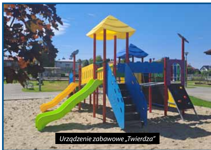
Urządzenie zabawowe „Twierdza”

11 kwietnia 2024 roku nastąpiło przekazanie placu budowy pod realizację prac ogólnobudowlanych i instalacyjnych w ramach zadania inwestycyjnego „Budowa żłobka w miejscowości Krasne”. Wykonawcą robót jest wybrana w wyniku postępowania przetargowego, firma Łukasz Korytko EL-PER. W ramach przedmiotowej umowy zostaną wykonane prace związane z przebudową i zmianą sposobu użytkowania pomieszczeń na I piętrze budynku klubu sportowego Crasnovia w Krasnem, pod potrzeby publicznego żłobka. Dla nowej funkcji obiektu zostanie również przebudowany układ komunikacyjny parteru oraz wybudowany plac zabaw, dostosowany dla dzieci uczęszczających do tego typu placówki opiekuńczej. Wartość robót budowlanych wynikających z umowy to 2 186 815,00 zł. 4 czerwca br. Wójt Gminy Krasne Jacek Maternia podpisał z firmą JAR sp. z o.o. z Kielnarowej, umowę na wykonanie robót drogowych, polegających na wykonaniu nowej nawierzchni bitumicznej na części przeznaczonej pod miejsca postojowe, plac manewrowy i na drodze stanowiącej dojazd, pod potrzeby klubu Crasnovia oraz żłobka, za kwotę 478 432,73 zł. W kolejnym etapie gmina Krasne przystąpi do kompleksowego wyposażania obiektu. Planowany termin uruchomienia placówki to IV kwartał 2024 roku. W nowym żłobku powstanie 60 miejsc dla najmłodszych mieszkańców gminy Krasne (dzieci w wieku do lat 3). Przypominamy, że gmina Krasne na realizację tej inwestycji, pozyskała dofinansowanie w wysokości 2 442 030,06 zł, w ramach rządowego programu „MALUCH+” 2022-2029.