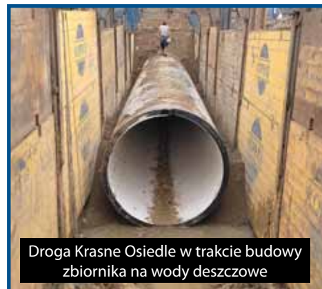
Droga Krasne Osiedle w trakcie budowy zbiornika na wody deszczowe

W dniu 21.06.2024 r. dokonano obioru prac I etapu budowy i przebudowy oczyszczalni ścieków w Krasnem, mającego na celu poprawę standardów oczyszczania ścieków, bez zwiększania jej przepustowości, która na chwilę obecną wynosi 600 m 3 /d. W ramach inwestycji zostały stworzone możliwości retencyjne na wypadek ponadnormatywnych przepływów wynikających z ekstremalnych zjawisk pogodowych poprzez budowę nowego reaktora biologicznego oraz zamianę funkcji istniejących reaktorów na zbiorni-