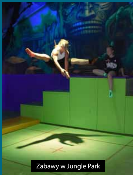
Zabawy w Jungle Park