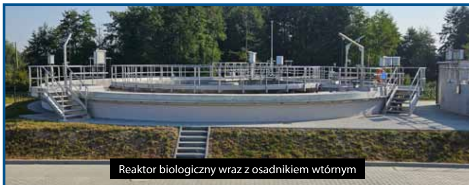
Reaktor biologiczny wraz z osadnikiem wtórnym