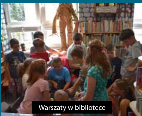
Warsztaty w bibliotece