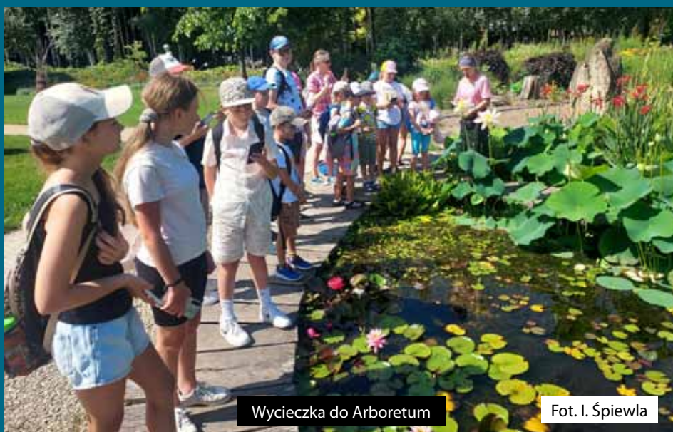
Wycieczka do Arboretum