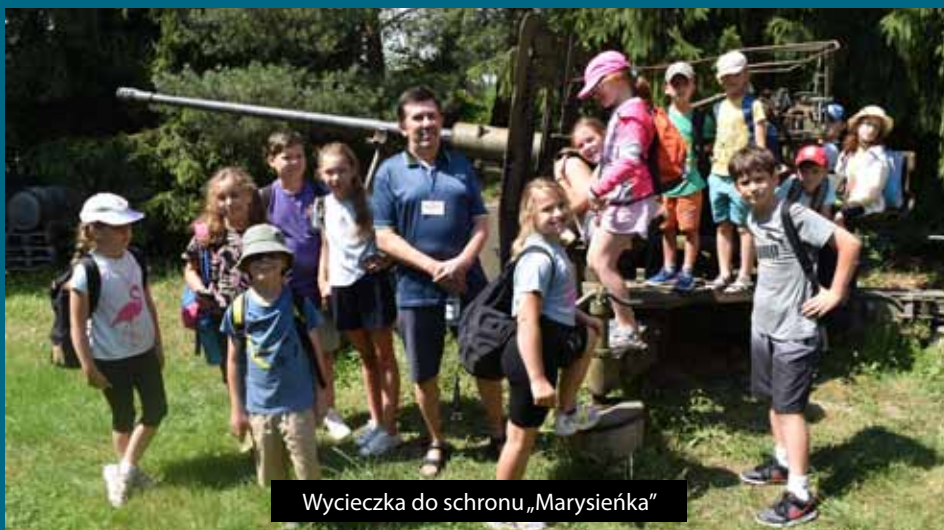
Wycieczka do schronu „Marysieńka”