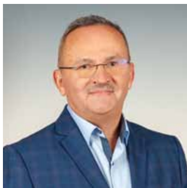
SOŁTYS SOŁECTWA KRASNE