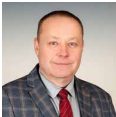
SOŁTYS SOŁECTWA STRAŻÓW